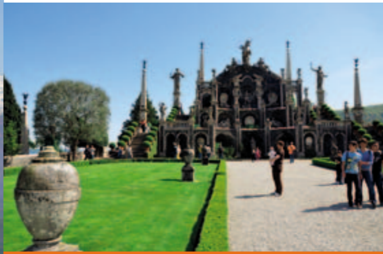
A l'île Bella, Amour chevauche une licorne.

peu après Domodossola, en direction de la vallée Formazza!